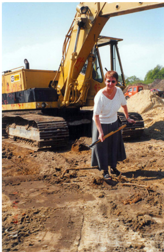
1. spadestik til afd. 46 i Skæggær den 20. maj 1999

Jeg er stolt af den udvikling vi i bestyrelsen har bidraget til omkring vision, målsætning og effektivisering, og udvikling af Arbejdernes Byggeforening til den moderne organisation, som den er i dag. Det er med til at skabe rammerne for det gode hjem for beboerne i Arbejderens Byggeforening.